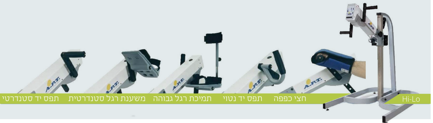
תפס יד סטנדרטי